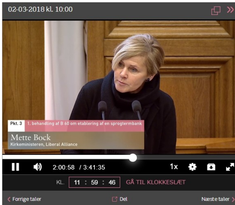
Kulturminister Mette Bock [LA].