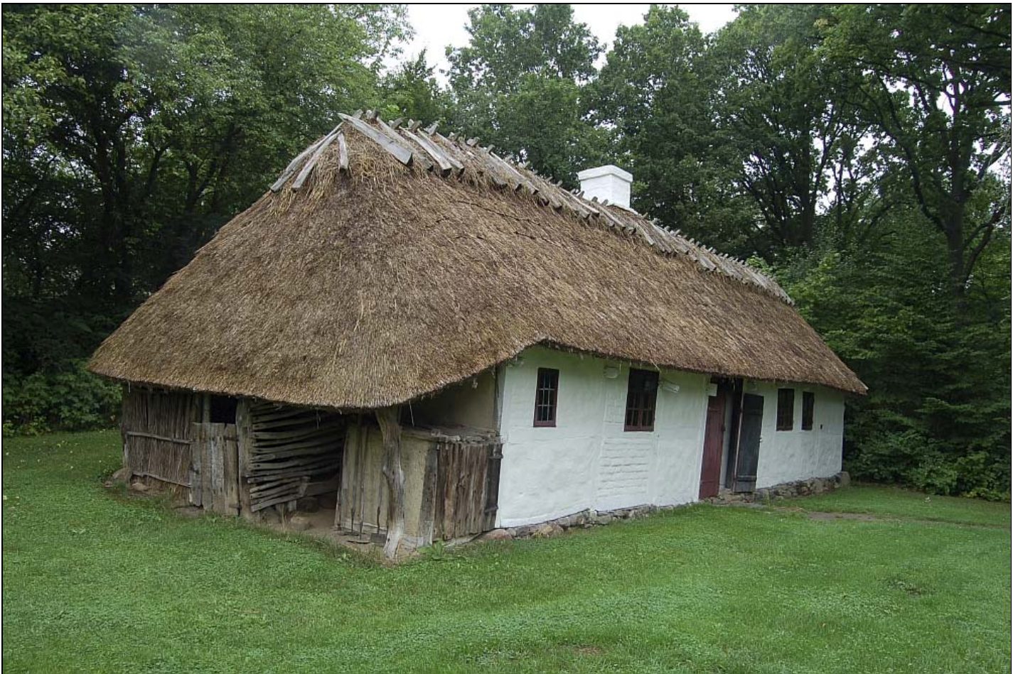
Væverstue fra Tystrup som den var i midten af 1800-tallet, Frilandsmuseet.

På Sjælland og Lolland Falster var mønstret lidt anderledes, idet vævningen i vid udstrækning udførtes af professionelle vævere, der var af hankøn. Det skyldes at hoveriarbejdet var så hårdt på disse øer, at man ikke havde tid til at væve så meget, at der var overskud til salg.