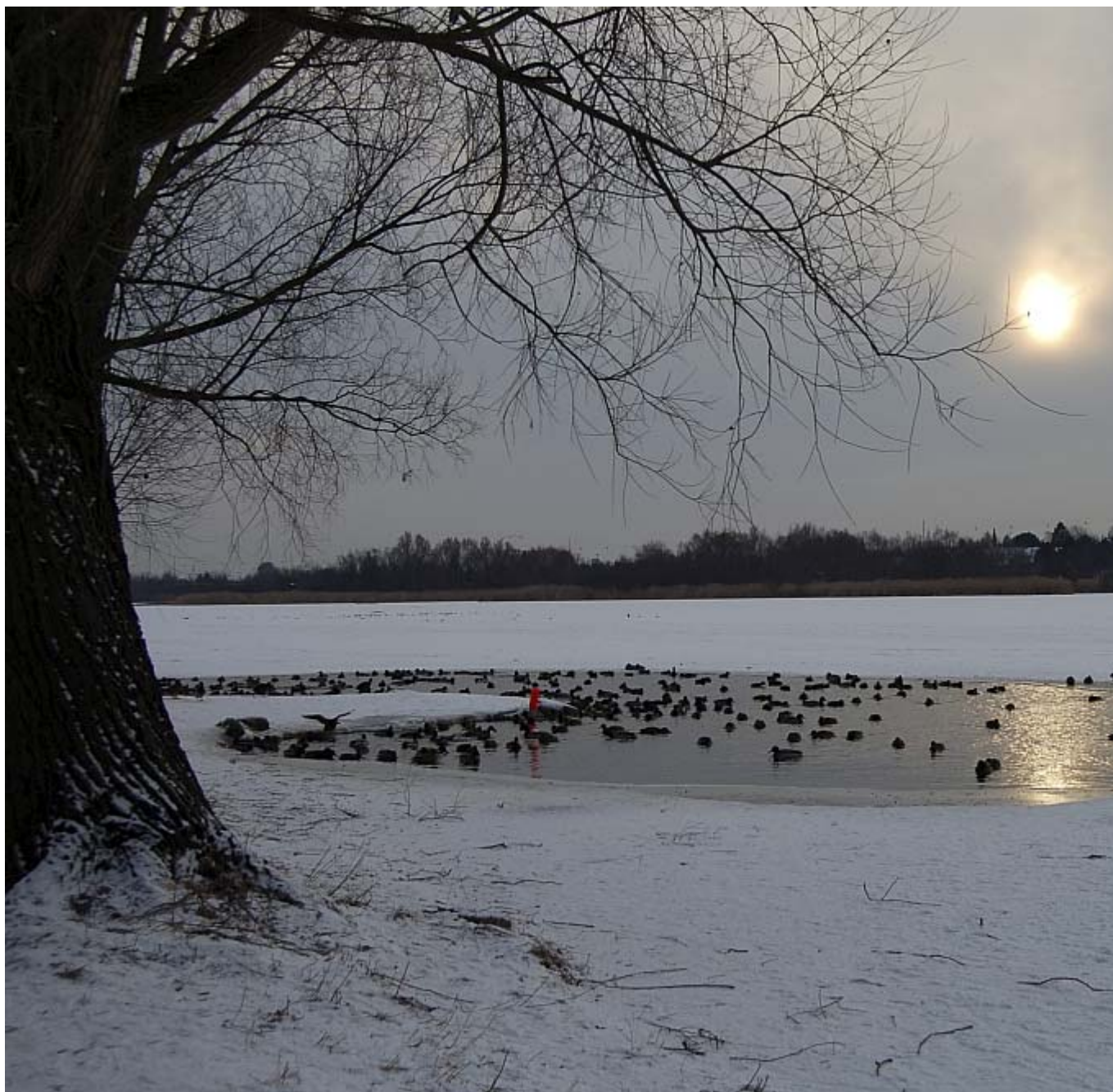
Gentofte Sø januar 2010.