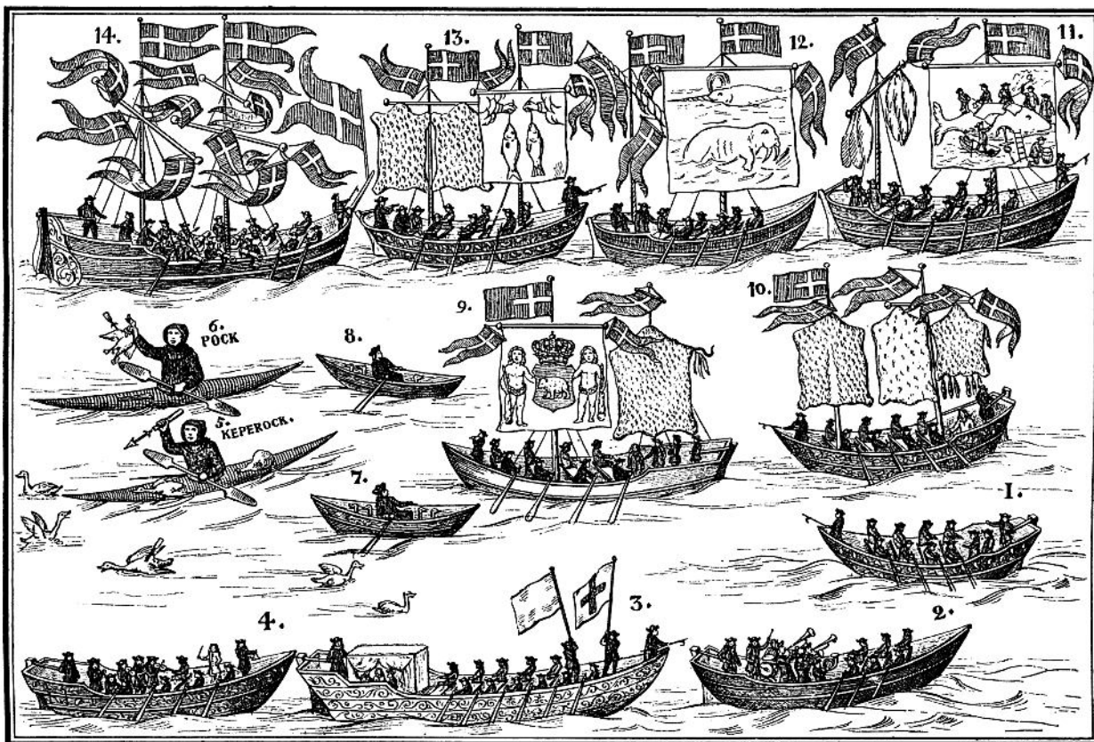
Det grønlandske Optog den 9de Novbr. 1724. (Efter et samtidigt Træsnit i Gross. Windings Samling.)