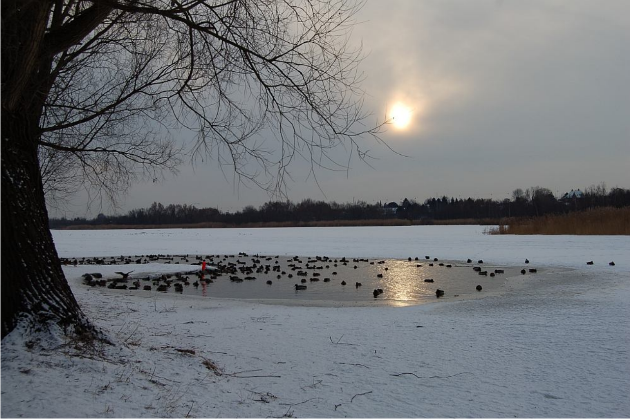
Gentofte Sø januar 2010.

prøve at ajourføre dem. Men man kan også gøre noget helt nyt, finde aktuelle problemer og håndtere dem på moderne vis.